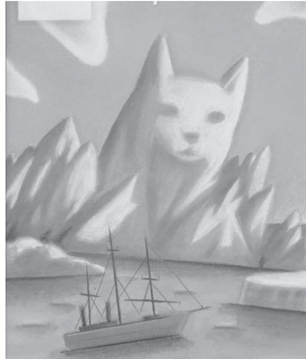
Détail de la couverture du Rêveur polaire .

Toute fiction renvoie à une autre qui la précède. Le narrateur du Rêveur polaire , un des premiers textes courts de Laurent Chabin destinés au lectorat enfantin en 1996, montrait la surprise qu'expérimente l'explorateur Roald Amundsen dans son voyage dans l'Arctique en découvrant un manuscrit dans une bouteille et en déchiffrant une signature: « ça